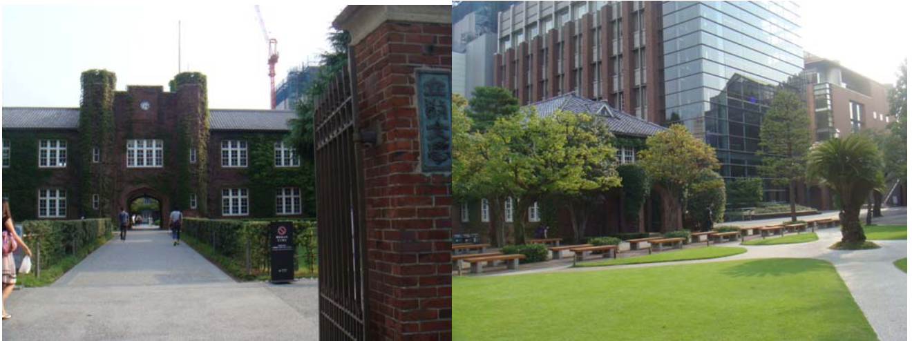
*池袋校區校園一景

日本人吸菸的比例頗高，在小小的校園裡就設置了四、五個吸菸區。雖然有吸菸區，但因為是開放的空間，所以經過時還是會聞到煙味，這一點滿令人厭惡的。