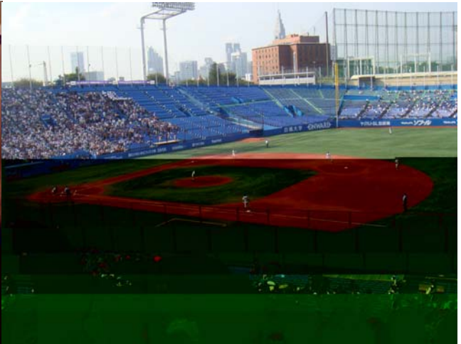
* 棒球比賽(立教 v. s 早稻田)