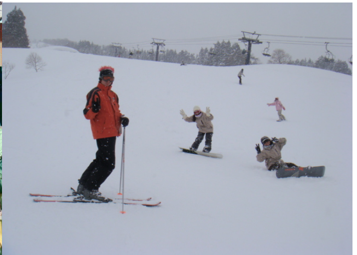
* 新瀉滑雪四天三夜