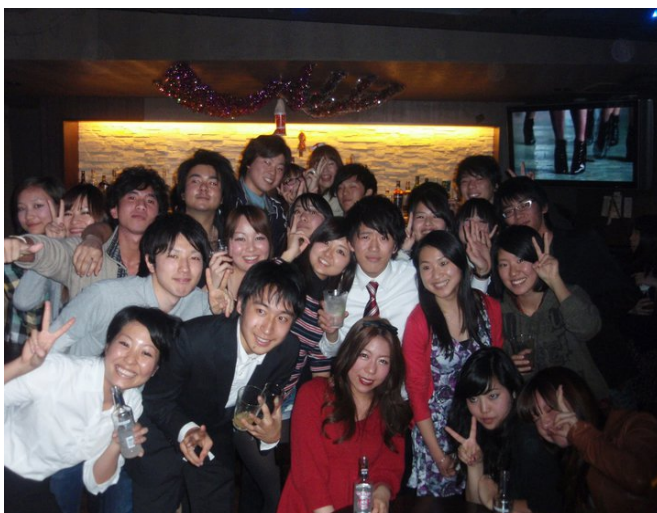
*Seminar 的期末 Party

立教大學學生很多，光一個系一個年級就約有三百人，且他們並不像我們會有班級制，因此他們最好的朋友常常會是同個 Semi 裡面的人。除了每個禮拜 semi 的上課時間外，他們私底下也很多聚會，所以如果能參加 semi，我覺得會是很好的選擇。